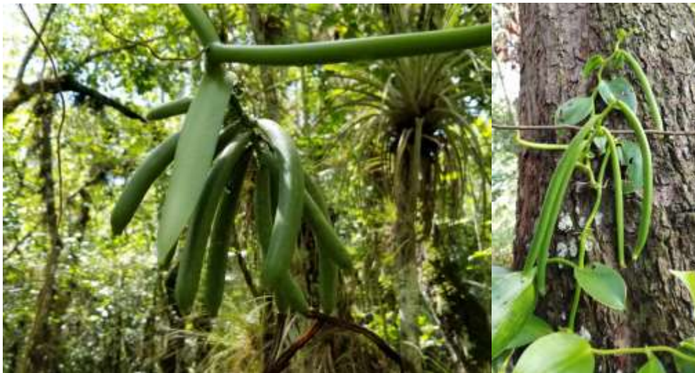
Figura 3. Desarrollo del frijol en ausencia de polinización manual para V. phaeantha (izquierda) y V. mexicana (derecha) en áreas naturales.