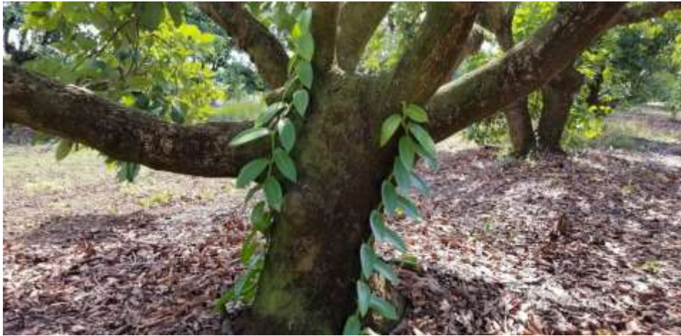
Figura 4. V. pompona que crece en un árbol de aguacate. Las vides se recibieron como esquejes de ~ 1 metro de largo. El crecimiento es después de un año sin riego suplementario.

lugar, dada la disponibilidad, consideraciones y co-cultivo. Este tipo de cultivo puede ser menos costoso en algunas áreas, y también reduce naturalmente el riesgo de muerte de la vid por Fusarium al aumentar la distancia entre las plantas. Los productores en el sur de Florida deberían considerar la vainilla como un cultivo secundario en los árboles frutales existentes. La Figura 4 muestra V. pompona creciendo en un árbol de aguacate. Cualquier insumo agrícola deberá ser compatible con ambas especies bajo el modelo de cultivos intercalados.