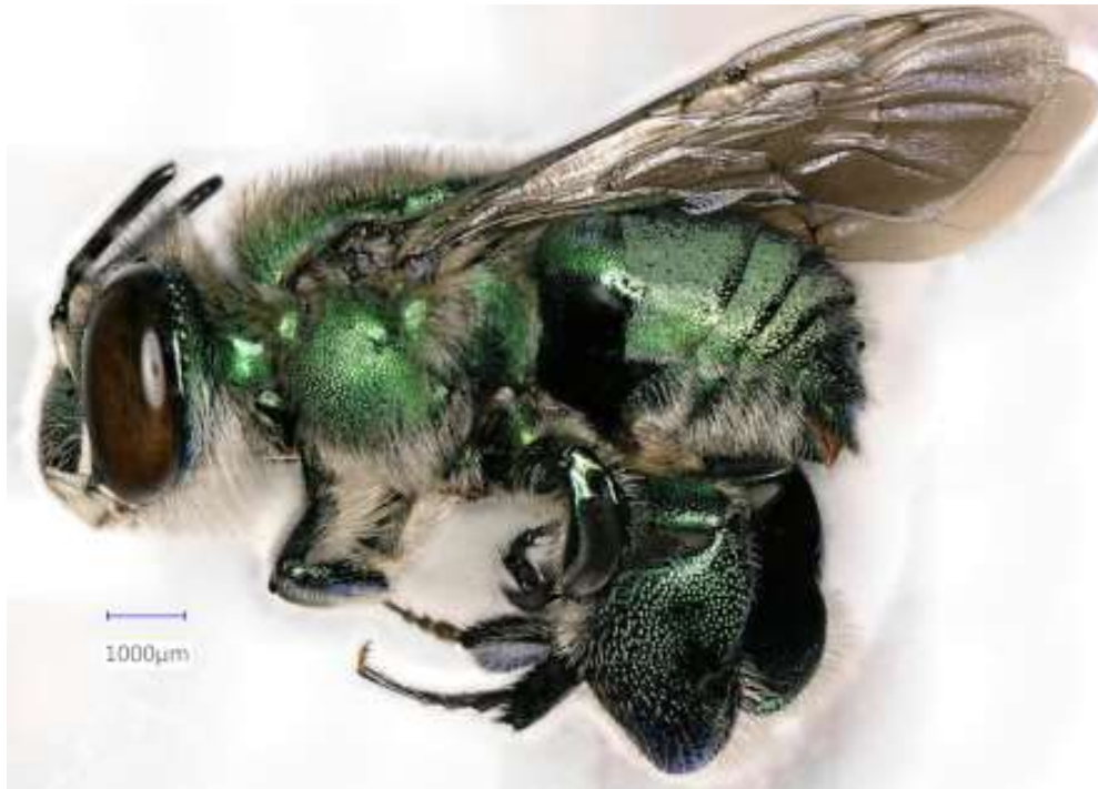
Figura 2. Dilema de Euglossa atraído y capturado en el Centro de Investigación y Educación Tropical de la Universidad de Florida. Esta abeja podría ser un polinizador de orquídeas de vainilla (Crédito de la foto: Daniel Carrillo, Universidad de Florida).