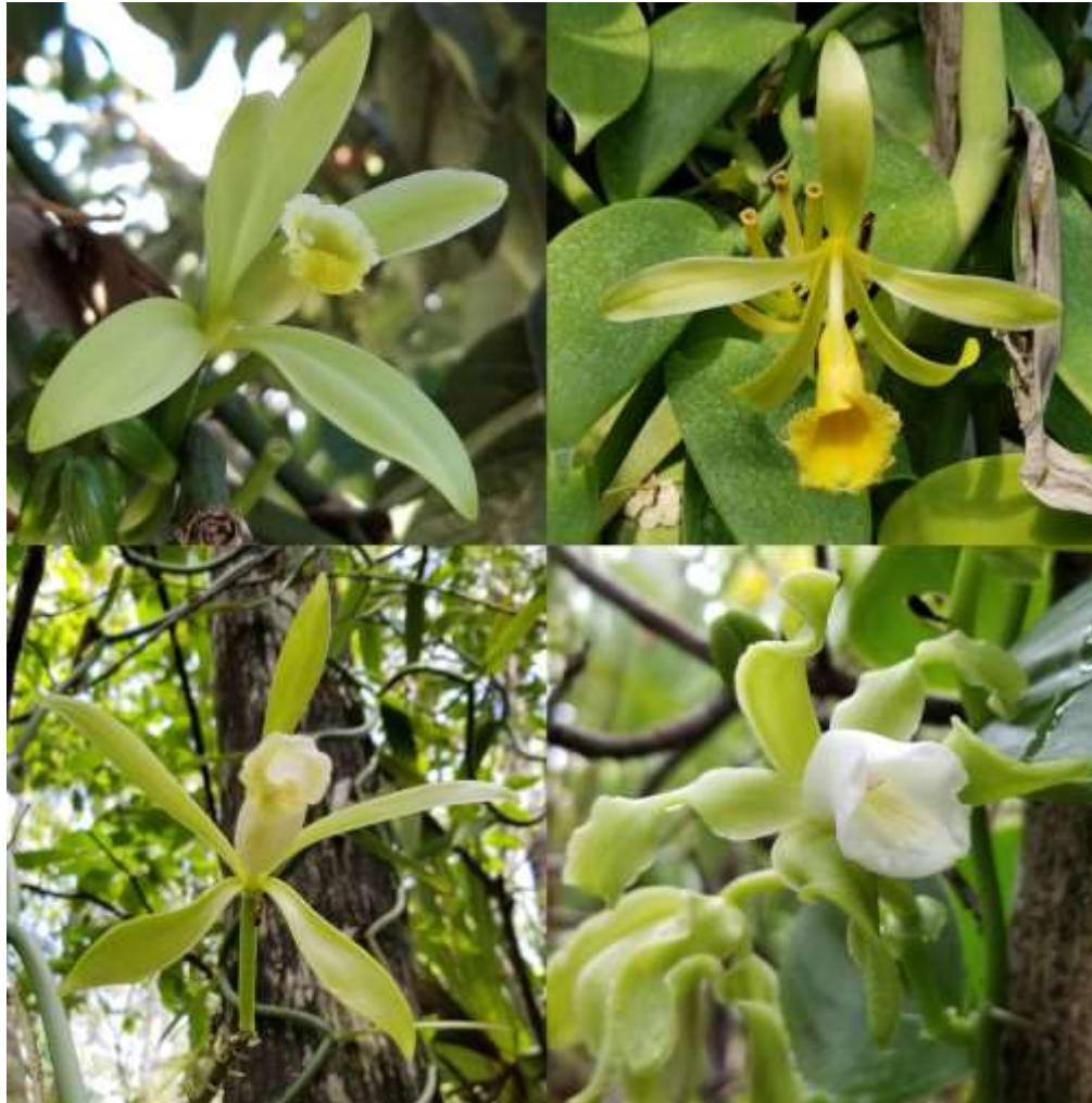
Figura 1. Flores de V. planifolia (arriba a la izquierda), V. pompona (arriba a la derecha), V. phaeantha (abajo a la izquierda) y V. mexicana (abajo a la derecha) que crecen en el sur de Florida. V. barbellata y V. dilloniana son especies sin hojas que también crecen en el sur de Florida, pero no se ha observado floración en nuestra colección.

de vainilla de Florida están en peligro y no deben ser cosechadas de áreas naturales sin la debida autorización y permiso de las autoridades reguladoras.